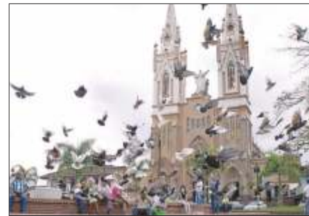
Lugar Monumento a los Fundadores y las Banderas.

02:00 p.m. Tarde cultural y deportiva Lugar Plaza principal